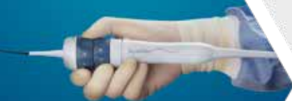
ACUSON AcuNav™ Ultrasound Catheter Intracardiac Echocardiography Imaging Guide