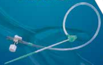
RAIN Sheath™ Transradial Thin-Walled Introducer