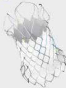
Venus P-Valve™ System