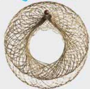
Atrial Flow Regulator (AFR)