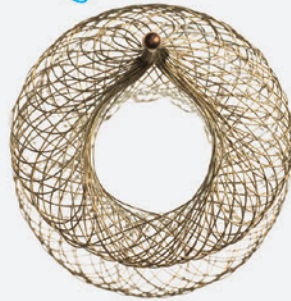
Atrial Flow Regulator (AFR)