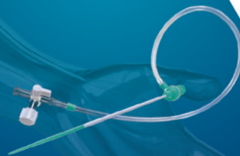
RAIN Sheath™ Transradial Thin-Walled Introducer