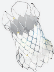
Venus P-Valve™ System