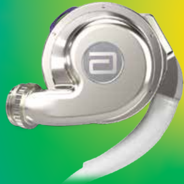
HeartMate 3™ Left Ventricular Assist Device

OUR HEARTMATE 3™ LVAD CAN HELP PEOPLE WITH ADVANCED HEART FAILURE FEEL BETTER AND LIVE LONGER. 1