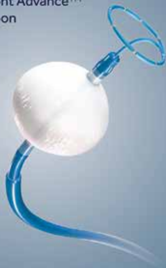
Arctic Front Advance™ Cryoballoon