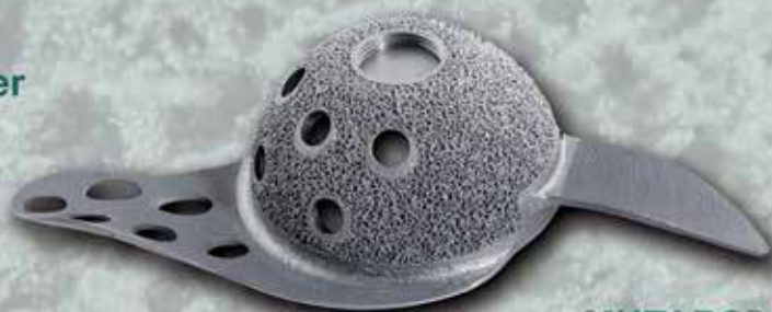
MUTARS® RS cup