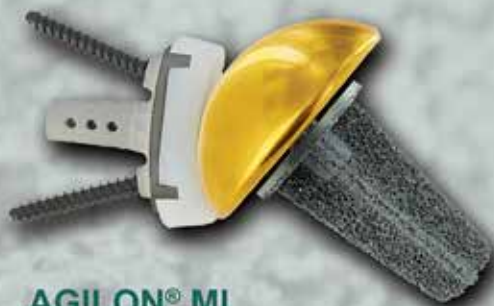
AGILON® MI metaphyseal implant